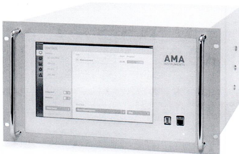
Рисунок 1.1 – Фотография общего вида хроматографа газового GC 5000 BTX № 200185628