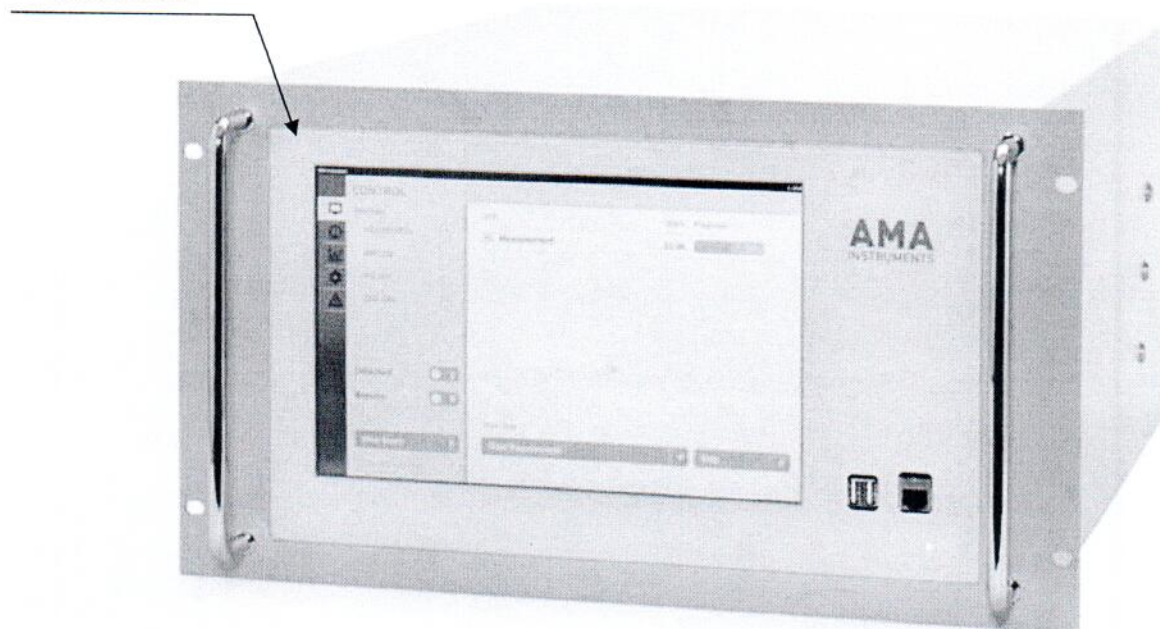
Рисунок 2.1 – Схема (рисунок) с указанием места для нанесения знака поверки