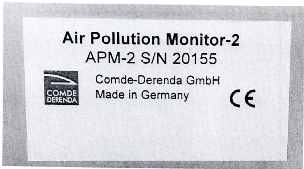
Рисунок 1.2 – Фотография маркировки анализатора пыли АРМ-2 № 20155