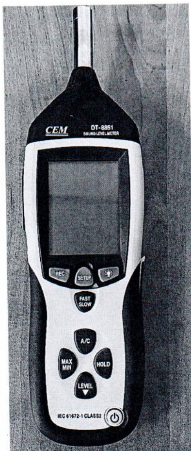
Рисунок 1.1 – Фотография общего вида измерителя уровня звука DT-8851 № 12044622