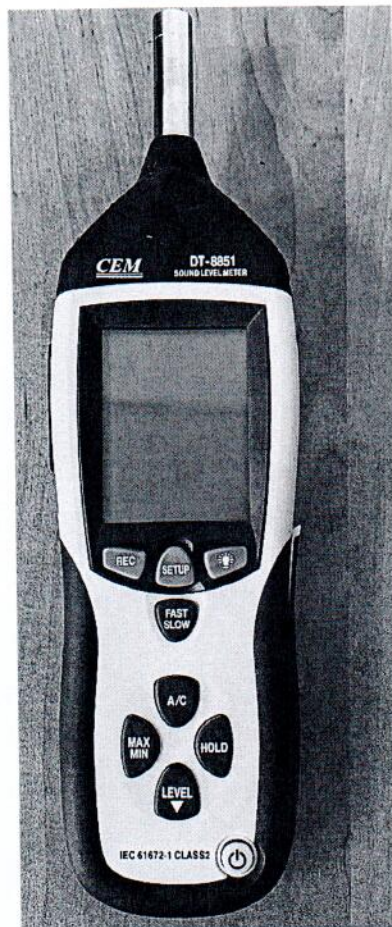
Рисунок 1.1 – Фотография общего вида измерителя уровня звука DT-8851 № 12044583