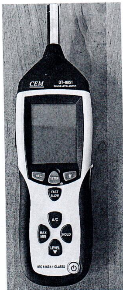
Рисунок 1.1 – Фотография общего вида измерителя уровня звука DT-8851 № 12044626