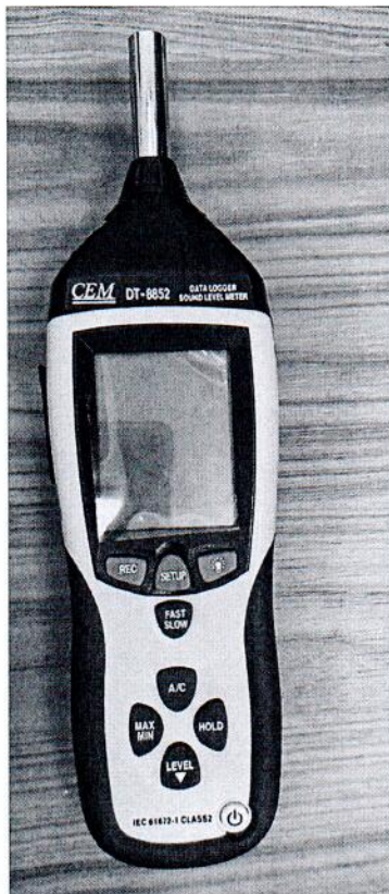
Рисунок 1.1 – Фотография общего вида измерителя уровня звука DT-8852 № 150301764