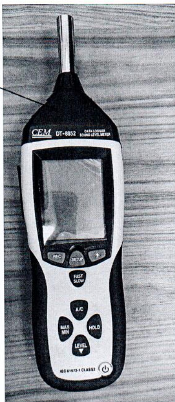
Рисунок 2.1 – Схема (рисунок) с указанием места для нанесения знака поверки