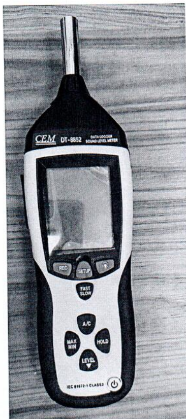
Рисунок 1.1 – Фотография общего вида измерителя уровня звука DT-8852 № 160529431