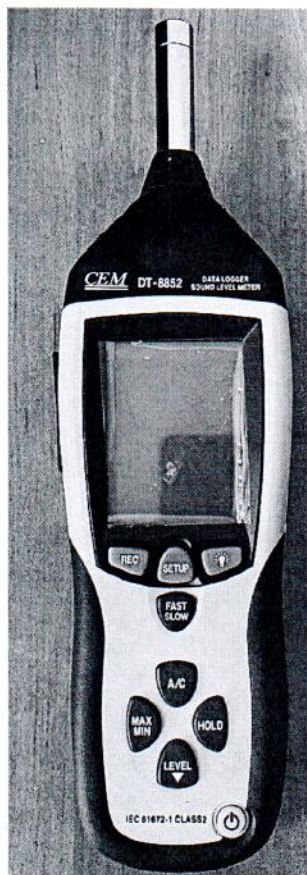
Рисунок 1.1 – Фотография общего вида измерителя уровня звука DT-8852 № 230737214