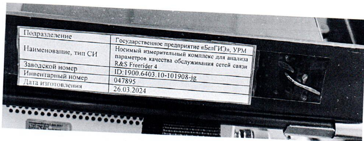
Рисунок 1.2 – Фотография маркировки носимого измерительного комплекса для анализа параметров качества обслуживания сетей связи R&S Freerider 4 № ID 1900.6403.10-101908-jg