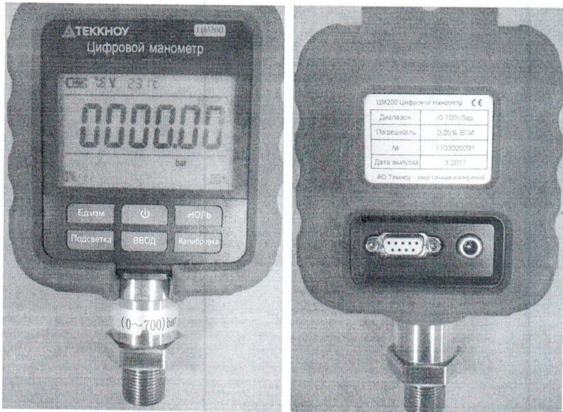
Рисунок 2 – Внешний вид манометра цифрового серии ЦМ200