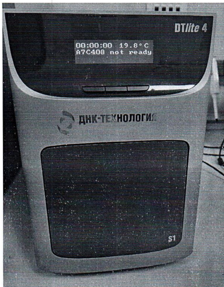
Рисунок 1.1 – Фотография общего вида амплификатора детектирующего ДТлайт 4S1 № А7С408