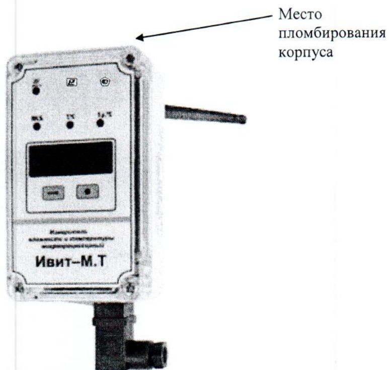
Рисунок 3 – Общий вид измерителей ИвИТ-М.Т конструктивного исполнения К1, К2