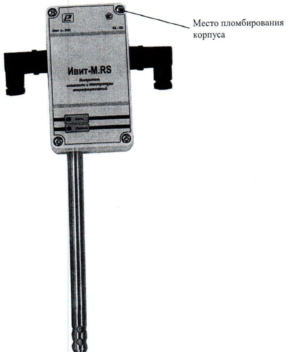
Рисунок 1 – Общий вид измерителей ИВИТ-М.РС конструктивного исполнения Н1, Н1Ф