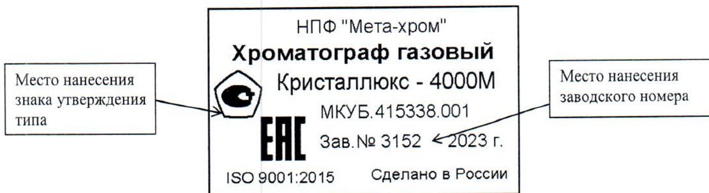
Рисунок 3 – Места нанесения знака утверждения типа и заводского номера

Места нанесения знака утверждения типа и заводского номера указаны на рисунке 3.