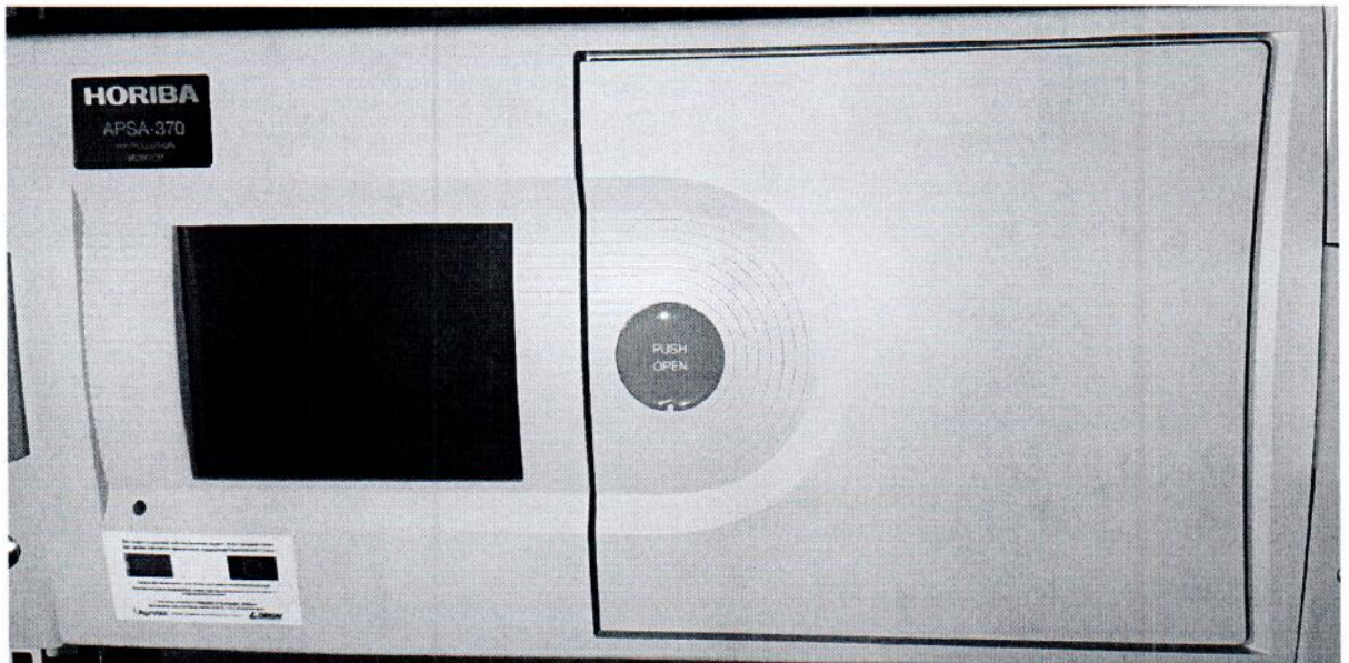
Рисунок 1.1 – Фотография общего вида анализатора диоксида серы APSA-370 № 904713