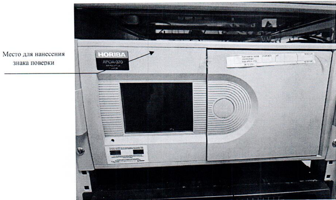
Рисунок 2.1 – Схема (рисунок) с указанием места для нанесения знака поверки

Схема (рисунок) с указанием места для нанесения знака поверки средств измерений