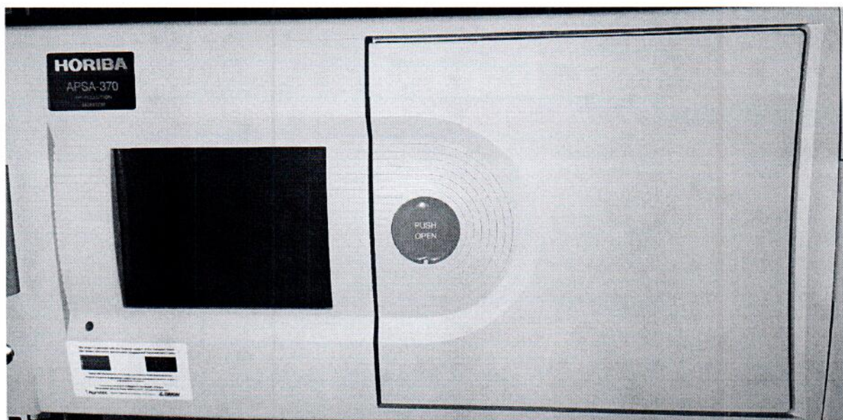
Рисунок 1.1 – Фотография общего вида анализатора диоксида серы APSA-370 № 904702