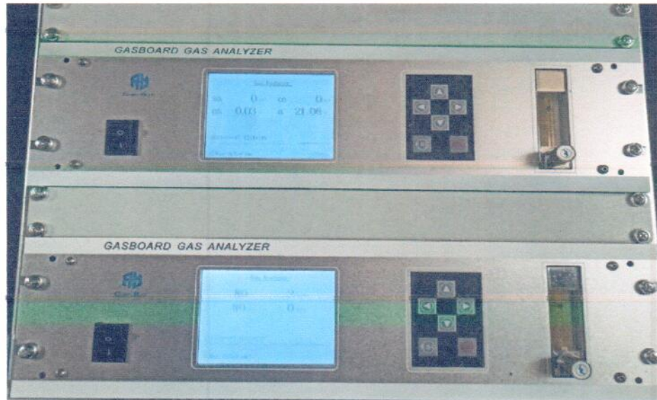
Рисунок 1.1 – Фотография анализаторов газа Gasboard-3000Plus