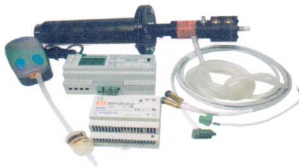
Рисунок 1.2 – Фотография анализатора кислорода ТДК-3М