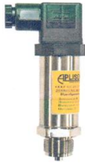
Рисунок 1.4 – Фотография преобразователя давления измерительного РС-28