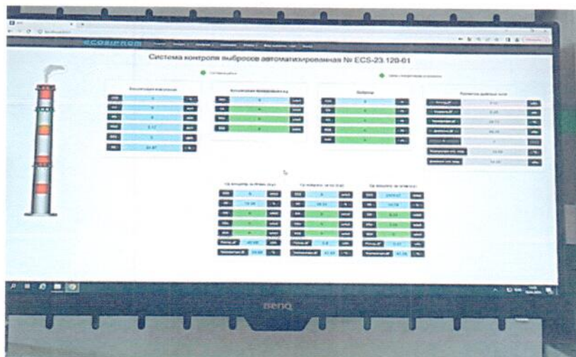
Рисунок 1.7 – Фотография снимка экрана монитора оператора