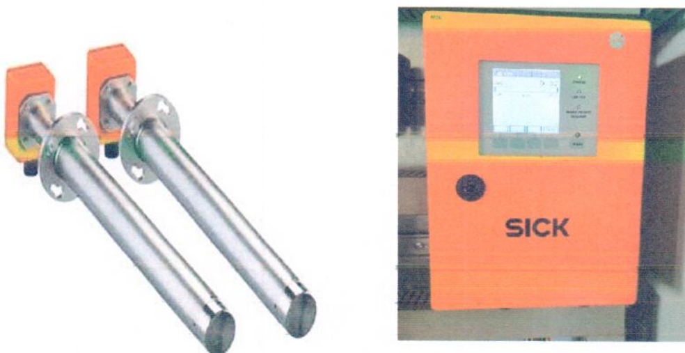
Рисунок 1.3 – Фотография измерителя скорости ультразвукового FLOWSIC100 H