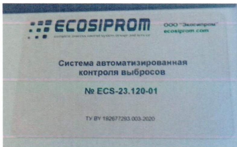
Рисунок 1.9 – Фотография маркировочной таблички