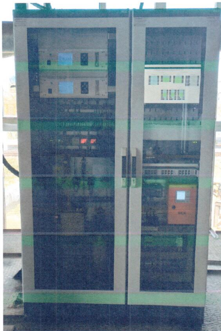
Рисунок 1.8 – Фотография шкафа газового анализа и шкафа серверного