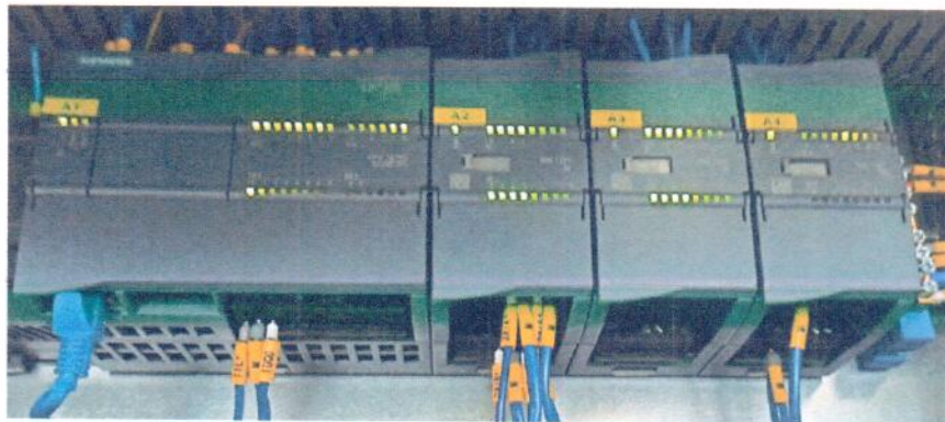
Рисунок 1.6 – Фотография контроллера программируемого SIMATIC S7-1200