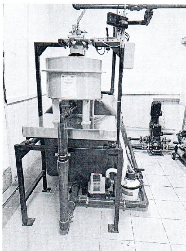
Рисунок 1.1 – Фотографии общего вида установки проливной расходомерной «ПОТОК 5.0-0.1» № 013