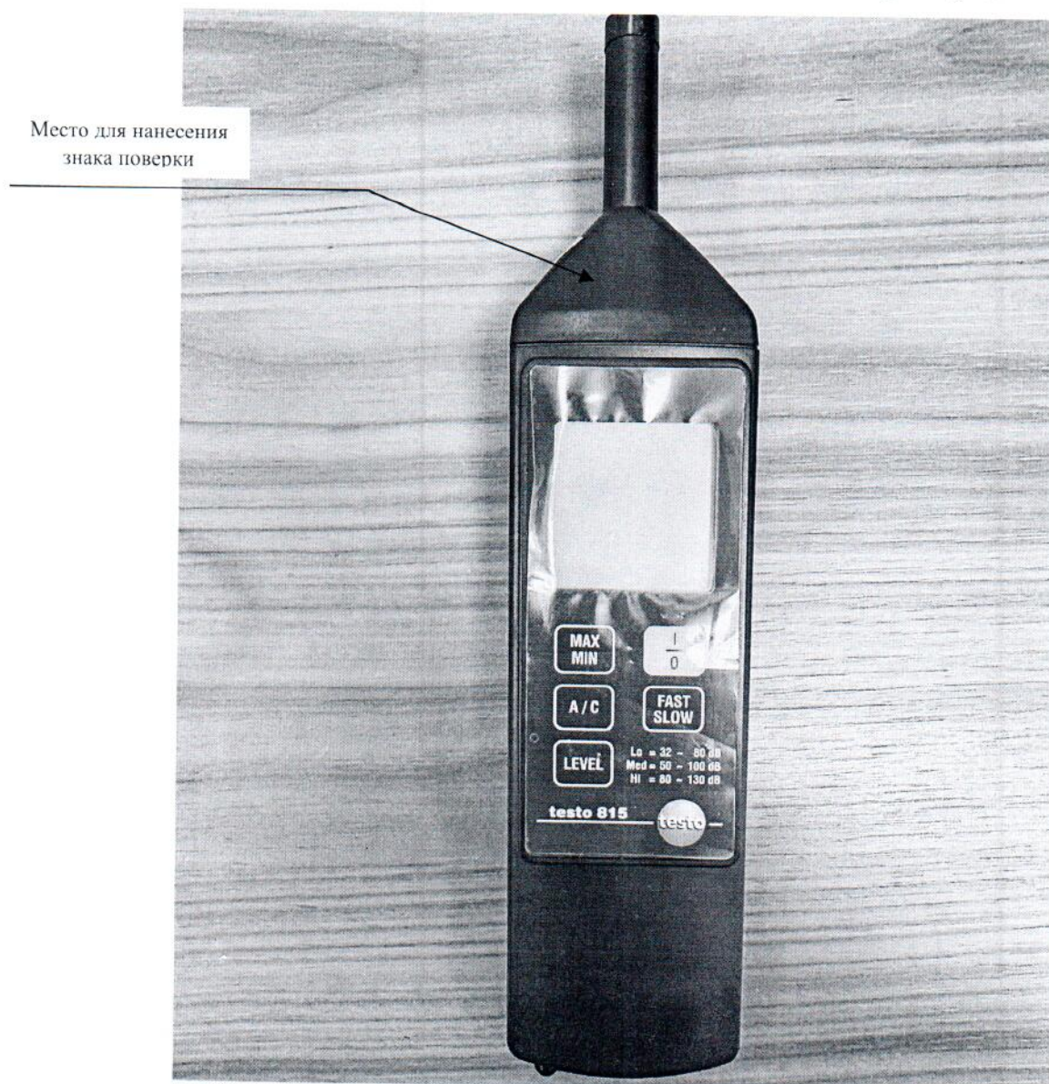
Рисунок 2.1 – Схема (рисунок) с указанием места для нанесения знака поверки

Схема (рисунок) с указанием места для нанесения знака поверки средств измерений