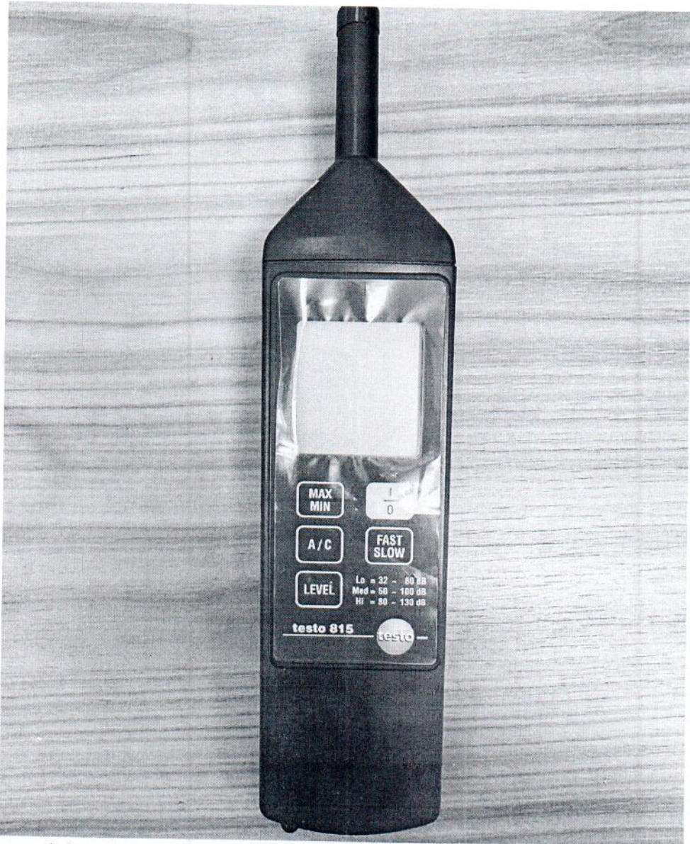
Рисунок 1.1 – Фотография общего вида измерителя уровня звука testo 815 № 30818543/502