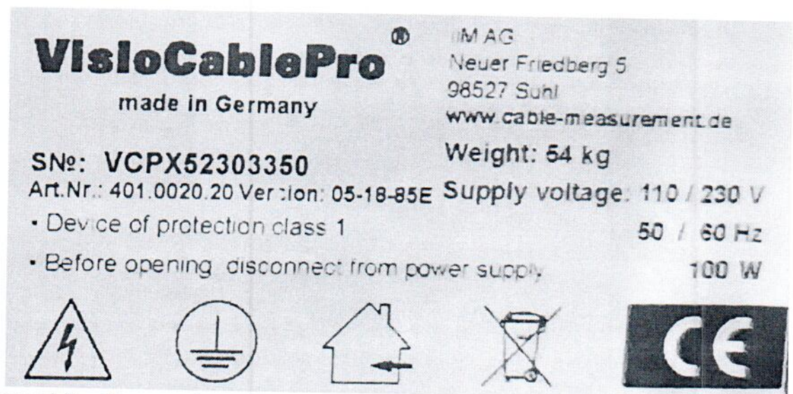
Рисунок 1.3 – Фотография маркировки прибора для измерения геометрических параметров кабеля VisioCablePro VCPX5 № VCPX52303350