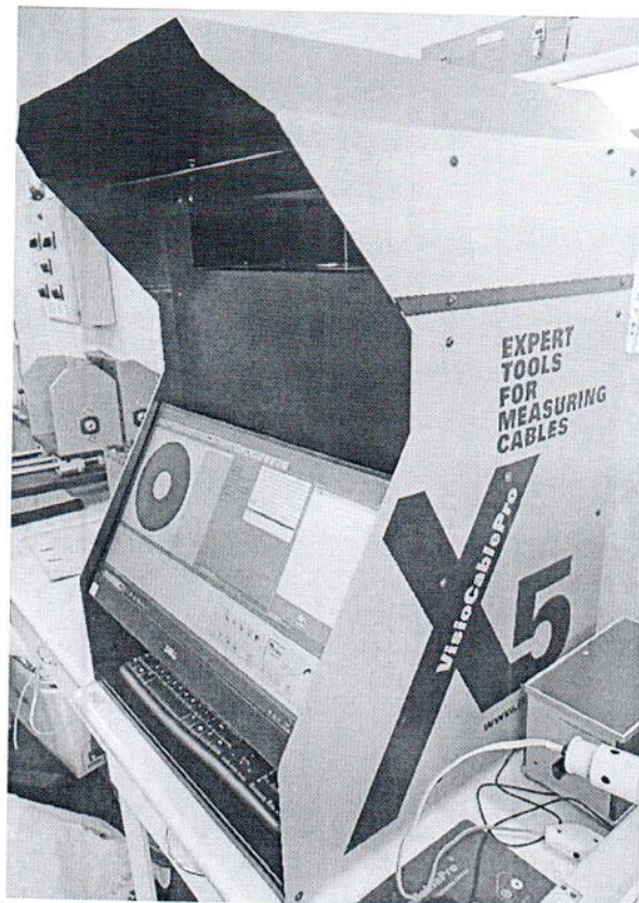
Рисунок 1.1 – Фотографии общего вида прибора для измерения геометрических параметров кабеля VisioCablePro VCPX5 № VCPX52303350