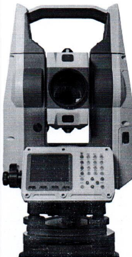
Рисунок 1.1 – Фотография общего вида тахеометров электронных EFT TS1 (изображение носит иллюстративный характер)