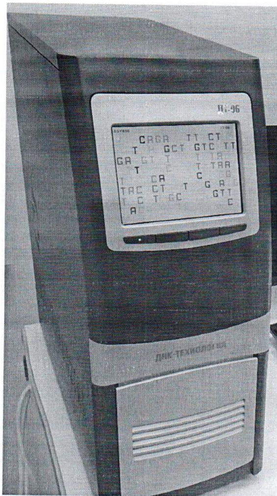
Рисунок 1.1 – Фотография общего вида амплификатора детектирующего ДТ-96 № А5У406