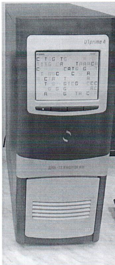
Рисунок 1.1 – Фотография общего вида амплификатора детектирующего ДТпрайм № А5D403

Фотографии общего вида средств измерений