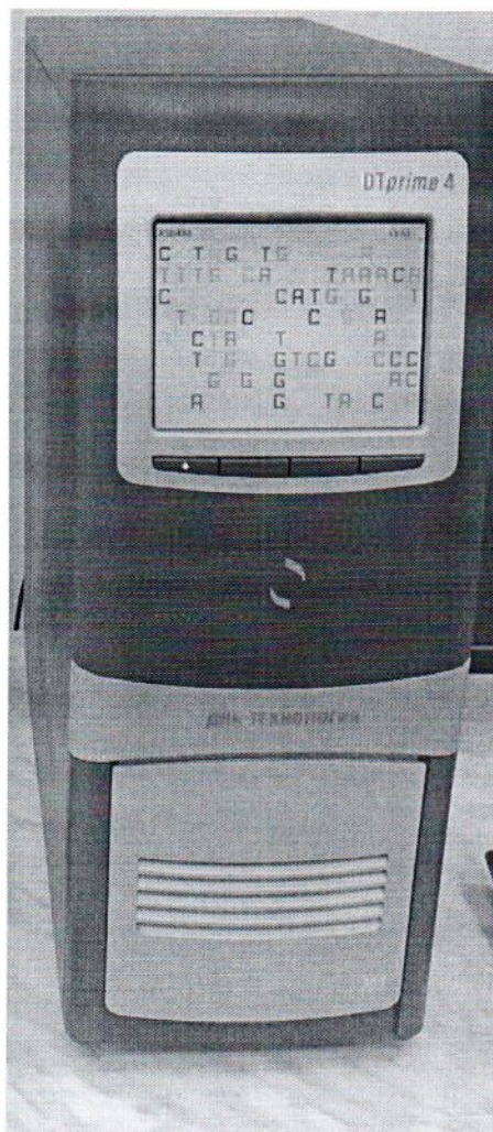
Рисунок 1.1 – Фотография общего вида амплификатора детектирующего ДТпрайм № А5С205