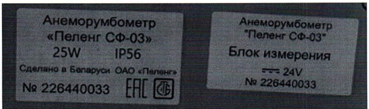
Рисунок 1.2 – Маркировка анеморумбометра «Пеленг СФ-03» (изображения носят иллюстративный характер)