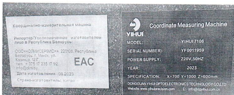
Рисунок 1.2 – Фотография маркировки координатно-измерительной машины YIHUI 7106 № YF0011959