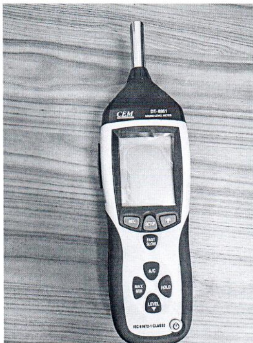
Рисунок 1.1 – Фотография общего вида измерителя уровня звука DT-8852 № 150301774