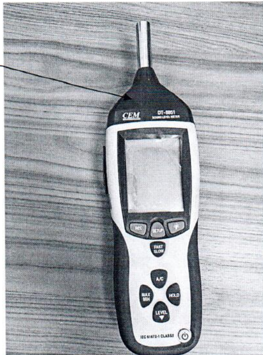
Рисунок 2.1 – Схема (рисунок) с указанием места для нанесения знака поверки