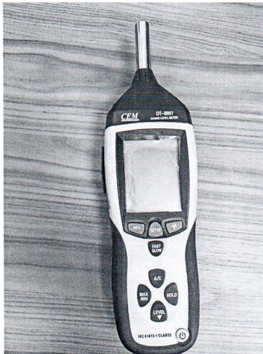
Рисунок 1.1 – Фотография общего вида измерителя уровня звука DT- 8851 № 12044596