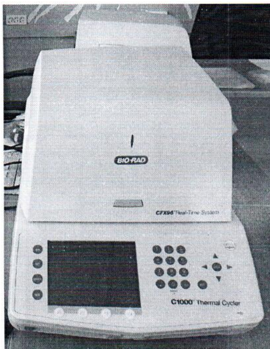
Рисунок 1.1 – Фотография общего вида термоциклера для амплификации нуклеиновых кислот модель C1000 Thermal Cycler № BR207422 с модулем оптическим реакционным CFX96™ № 787BR15756