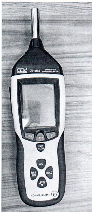
Рисунок 1.1 – Фотография общего вида измерителя уровня звука DT- 8852 № 12043906