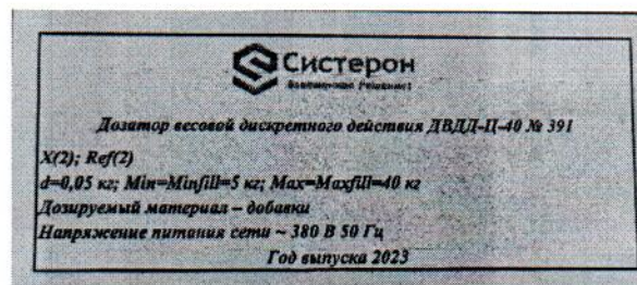
Рисунок 1.2 – Маркировка дозатора весового дискретного действия ДВДД-Ц-40 № 391