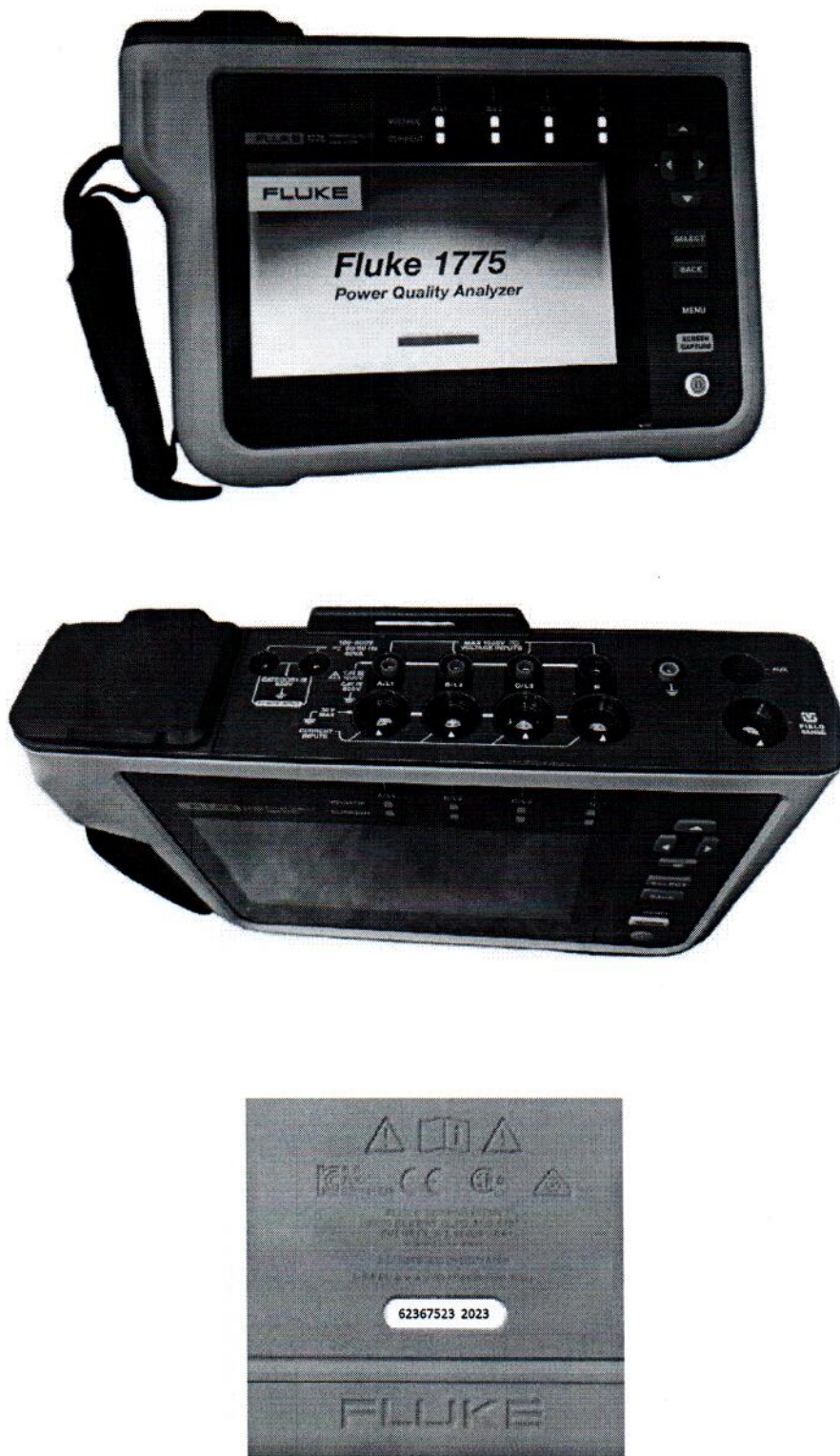
Рисунок 1.1 – Фотографии общего вида анализатора качества электроэнергии трёхфазных сетей Fluke 1775 № 62367523