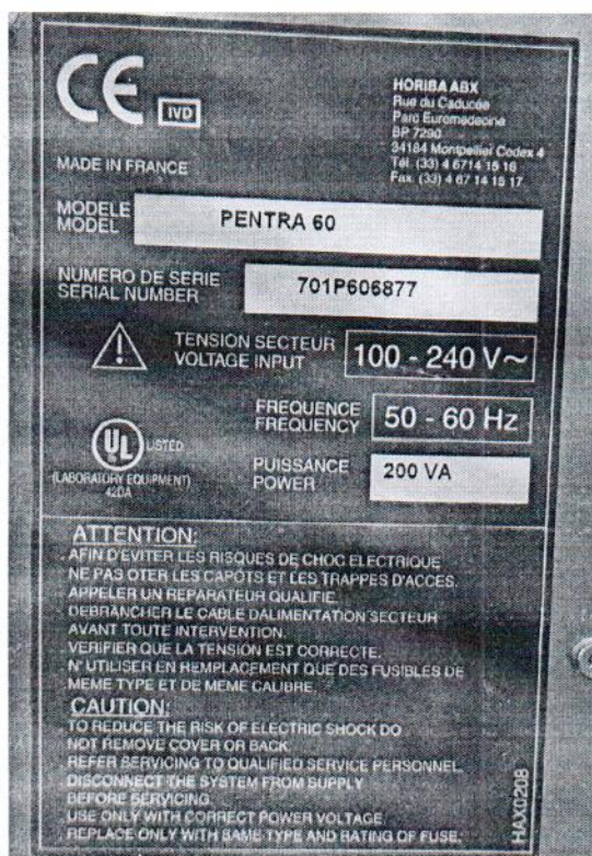
Рисунок 1.2 – Фотография маркировки анализатора гематологического автоматического PENTRA 60 № 701P606877