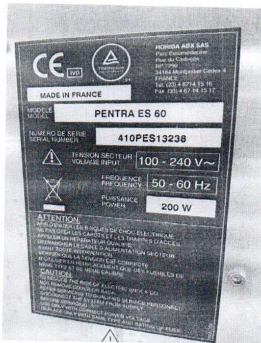
Рисунок 1.2 – Фотография маркировки анализатора гематологического автоматического PENTRA ES 60 № 410PES13238