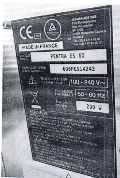
Рисунок 1.2 – Фотография маркировки анализатора гематологического автоматического PENTRA ES 60 № 606PES14242