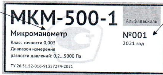
Рисунок 3 – Информационная табличка