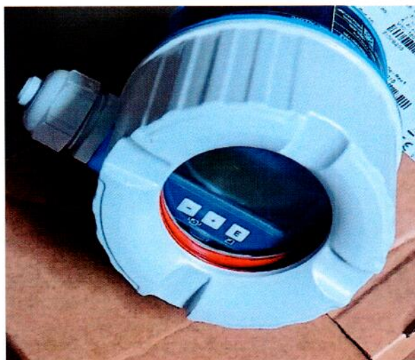
Рисунок 1.2 – Фотография общего вида встроенного цифрового дисплея преобразователя