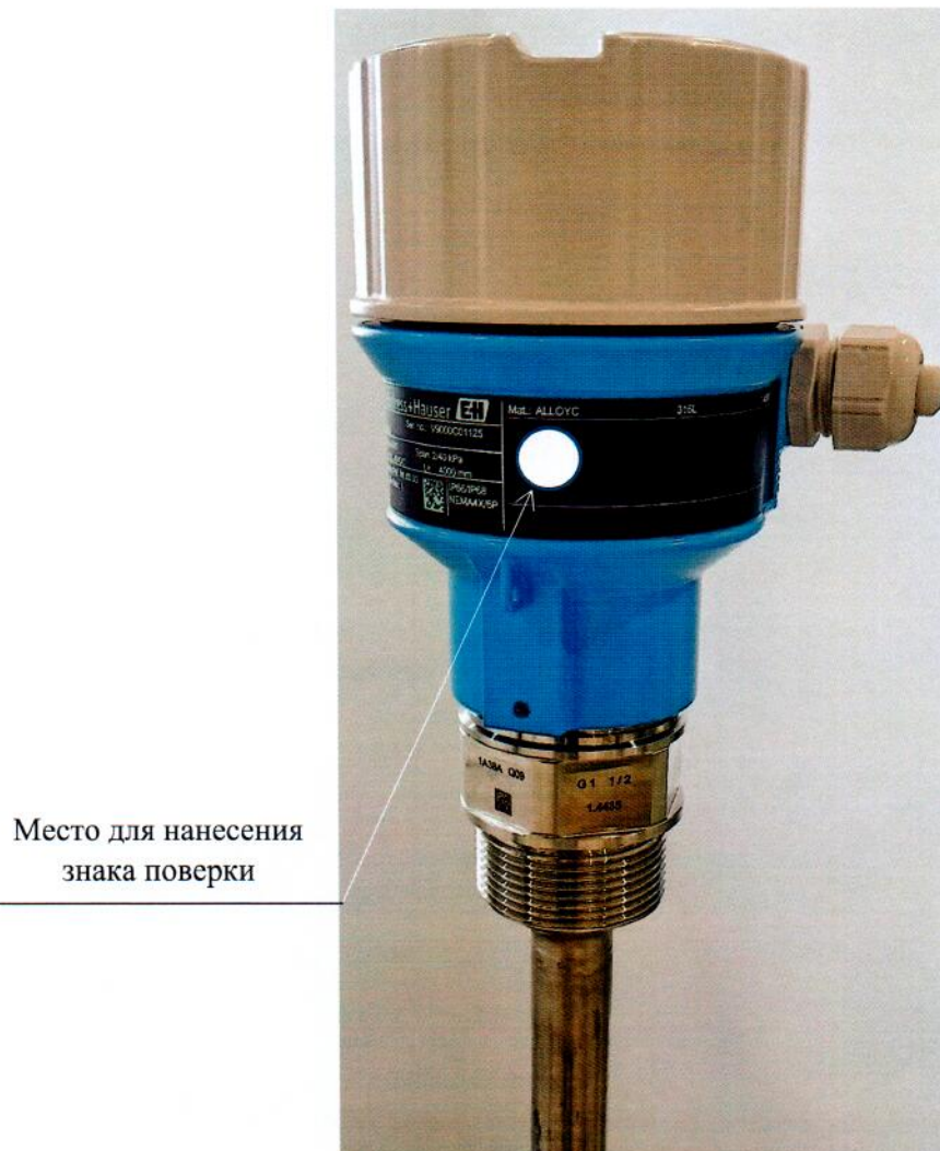
Рисунок 2.1 – Схема (рисунок) с указанием места для нанесения знака поверки средств измерений

Схема (рисунок) с указанием места для нанесения знака поверки средств измерений