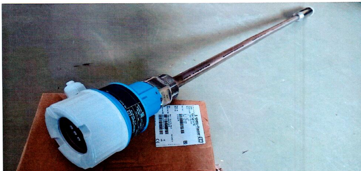
Рисунок 1.1 – Фотография общего вида преобразователя