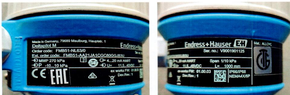
Рисунок 1.3 – Фотографии маркировки преобразователя