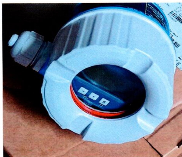
Рисунок 1.2 – Фотография общего вида встроенного цифрового дисплея преобразователя