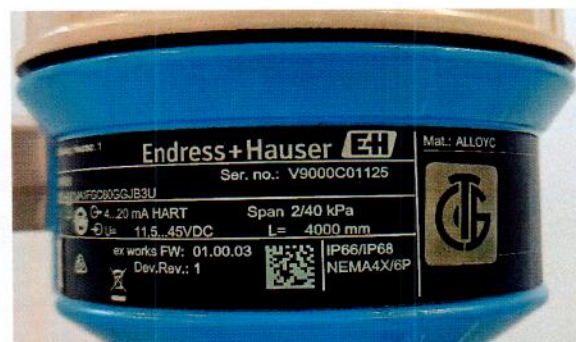
Рисунок 1.3 – Фотографии маркировки преобразователя