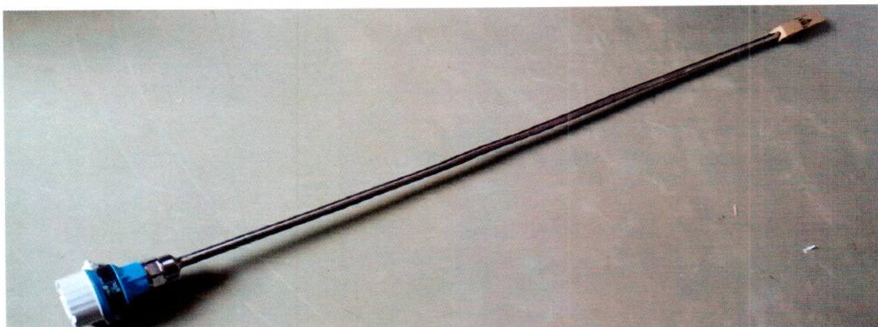
Рисунок 1.1 – Фотография общего вида преобразователя