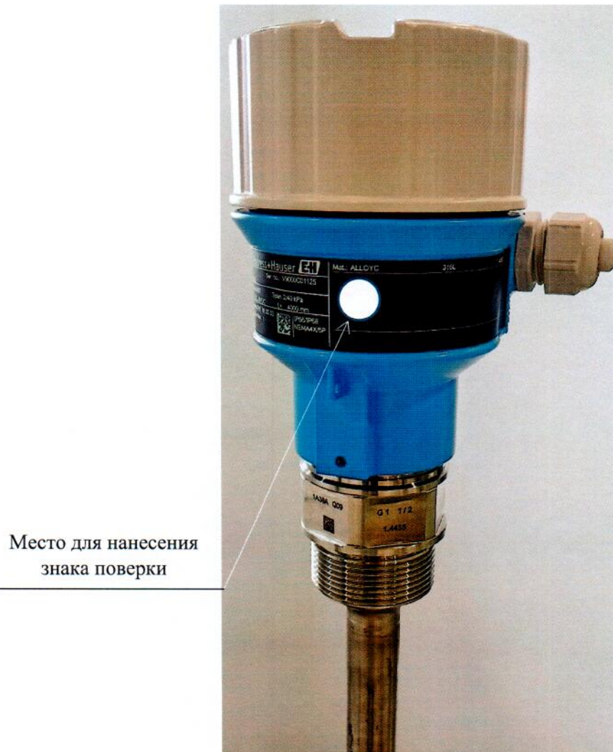
Рисунок 2.1 – Схема (рисунок) с указанием места для нанесения знака поверки средств измерений

Схема (рисунок) с указанием места для нанесения знака поверки средств измерений