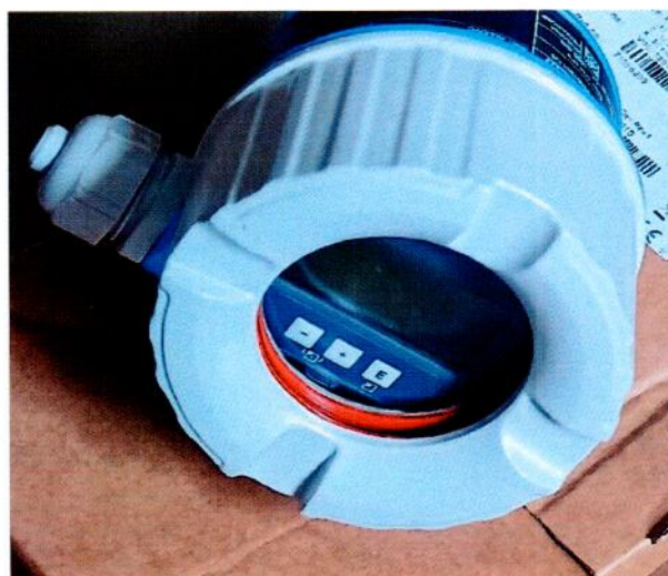
Рисунок 1.2 – Фотография общего вида встроенного цифрового дисплея преобразователя