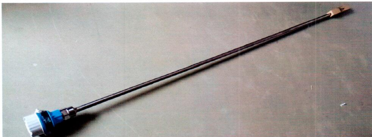
Рисунок 1.1 – Фотография общего вида преобразователя