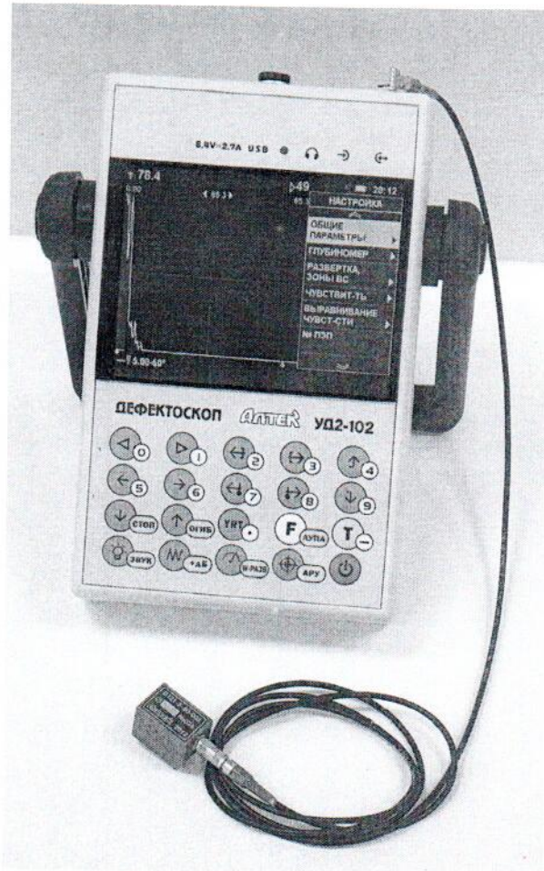
Рисунок 1 – Общий вид

БЭ включает в себя устройство обработки, приемо-возбудитель, клавиатуру и дисплей. Фотография общего вида дефектоскопа представлена на рисунке 1