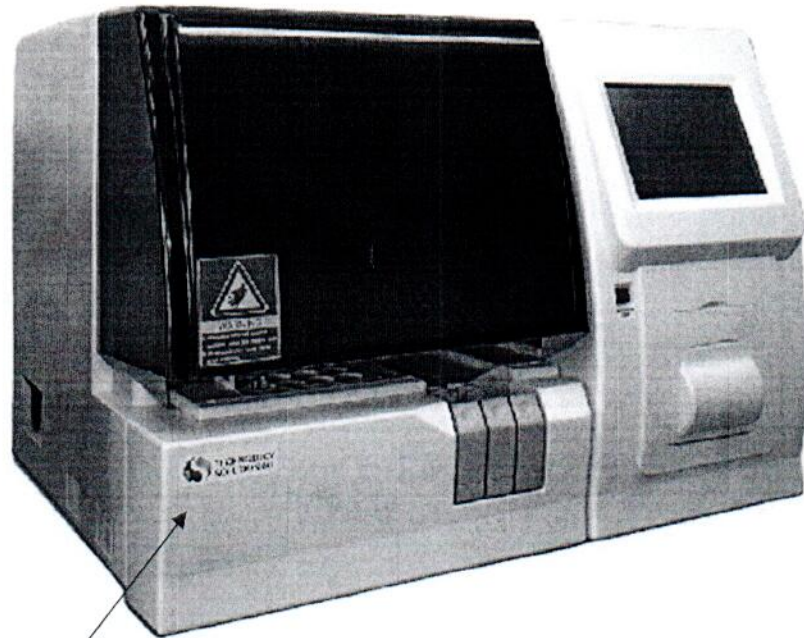
Схема (рисунок) с указанием места для нанесения знака поверки.