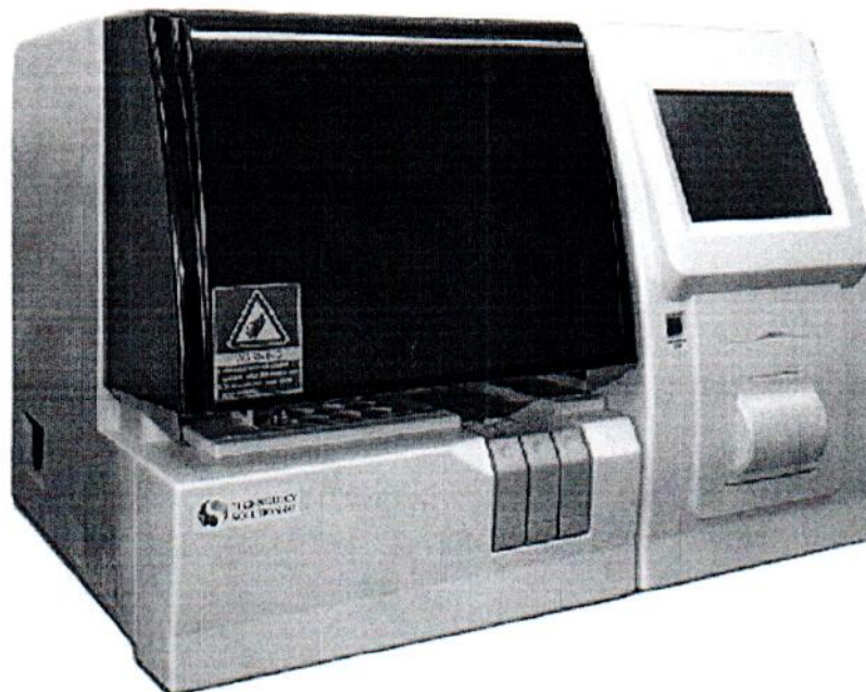
Рисунок 1.1 – Фотографии общего вида анализатора гемостаза автоматического: автоматический коагулометр «Technology Solution 60» (изображения носят иллюстративный характер)