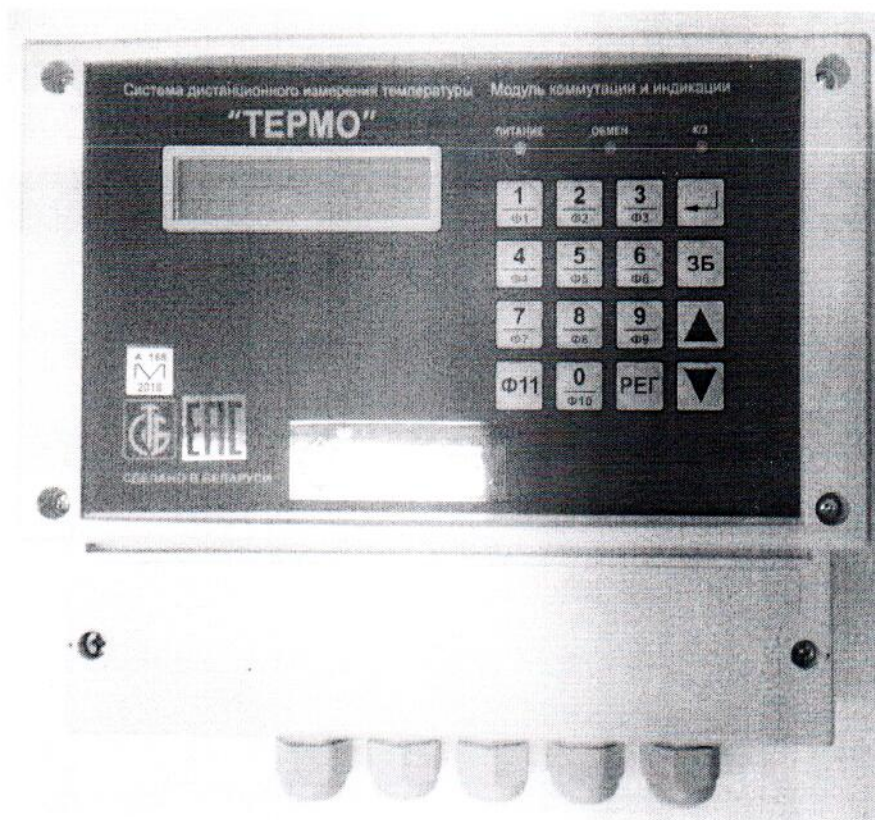
Рисунок 1 - Внешний вид модуля коммутации и индикации