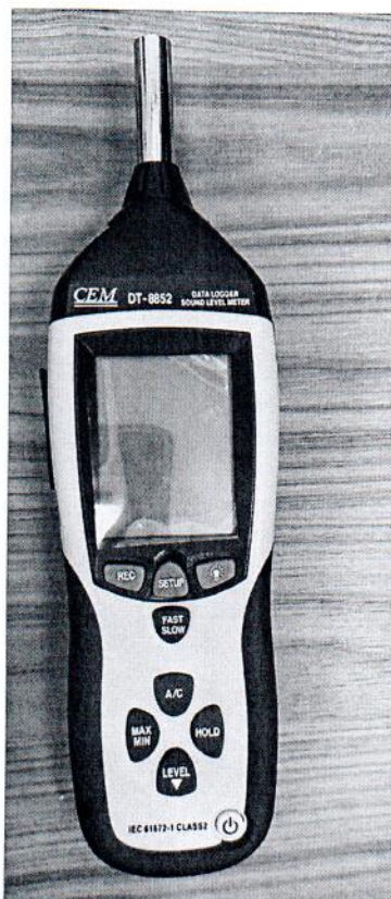
Рисунок 1.1 – Фотография общего вида измерителя уровня звука DT- 8852 № 140313365