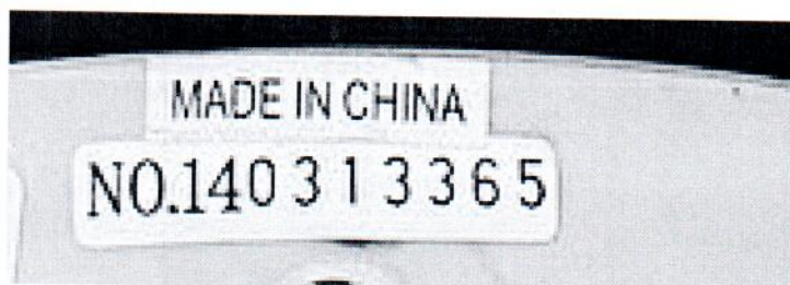
Рисунок 1.2 – Фотография маркировки измерителя уровня звука DT- 8852 № 140313365