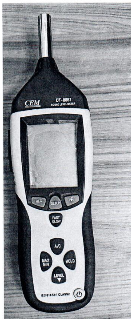
Рисунок 1.1 – Фотография общего вида измерителя уровня звука DT- 8851 № 12044679