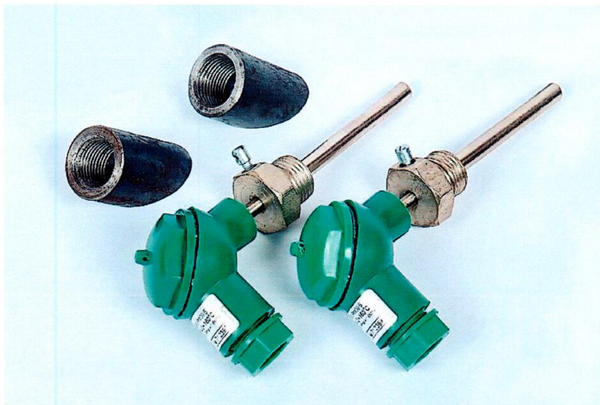
Рисунок 1.1 – Фотография общего вида комплекта ТСПА-К исполнения PL (носит иллюстративный характер)