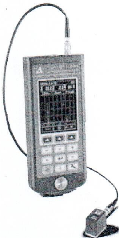
Рисунок 1 – Общий вид дефектоскопа ультразвукового A1211 Mini

Фотография общего вида дефектоскопа представлена на рисунке 1.