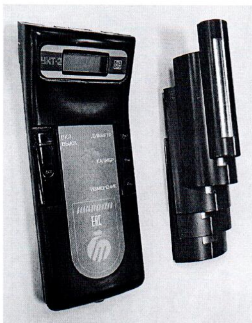
Рисунок 1.1 – Фотография общего вида устройства контроля толщины изоляции УКТ-2 (изображение носит иллюстративный характер)