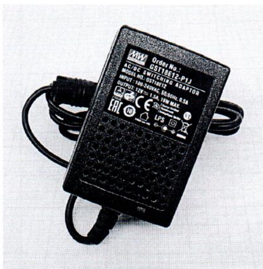
Рисунок 1.3 – Фотография общего вида адаптера сетевого (изображение носит иллюстративный характер)