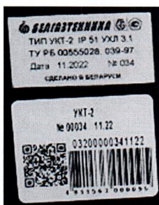
Рисунок 1.4 – Фотография маркировки устройства контроля толщины изоляции УКТ-2 (изображение носит иллюстративный характер)