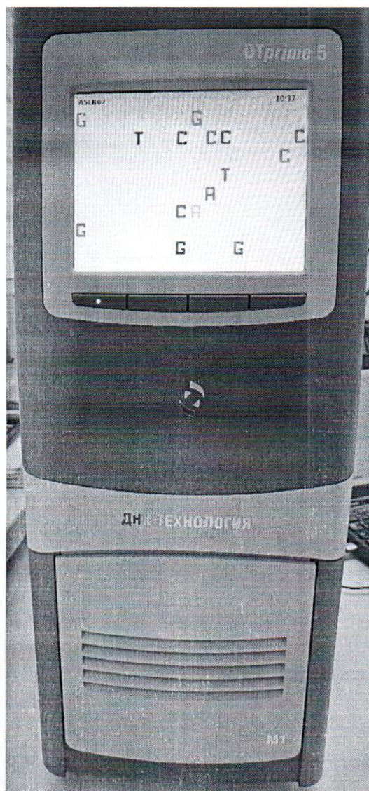
Рисунок 1.1 – Фотография общего вида амплификатора детектирующего ДТпрайм 5M1 № A5LN07