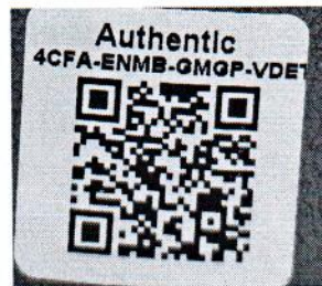
Рисунок 1.2 – Фотография маркировки манометра дифференциального показывающего Magnehelic 2000-500PA № 4CFA-ENMB-GMGP-VDET