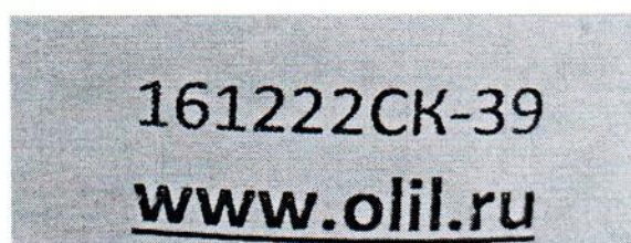
Рисунок 1.2 – Фотография маркировки манометра дифференциального показывающего Magnehelic 2000-60PA № 161222СК-39